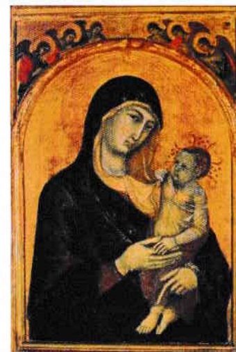
Duccio di Buoninsegna, Madonna con il Bambino e sei Angeli , 1300 – 1305, tempera su tavola, 97 x 93 cm, Perugia, Galleria Nazionale dell' Umbria

I cattolici si rivolgono alla Vergine Maria con molti titoli. In Italia, ma non nella liturgia, Lei viene normalmente chiamata "Madonna" (dal latino mea domina , "mia signora"). Per questo anche gli artisti hanno dato questo nome alle loro opere che La rappresentano.